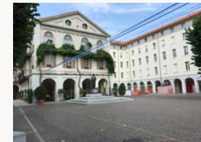
Erste Wirkungsstätte von Don Bosco

In der Stadt Turin gibt es viel zu entdecken, deswegen machen wir mit euch eine kleine Stadtführung. Des Weiteren ist in Turin die Grabstätte von Don Bosco, auch seine erste Jugendeinrichtung hat er dort gegründet. Das und noch mehr schauen wir uns dort an. Neben dem berühmten Turiner Grabschrein steht euch auch freie Zeit zum Stadtbummeln und Essen zur Verfügung.