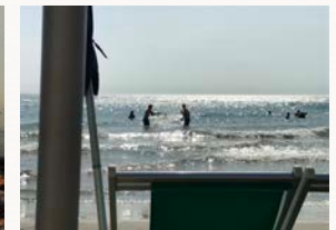
Baden im Mittelmeer gehört natürlich auch dazu...