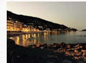
Alasio bei Nacht, richtiges Urlaubsflair...

Als Überraschung für euch haben wir eine kleine Fahrt ins Blaue vorbereitet: Entdeckt eine weitere Stadt an der Küste.