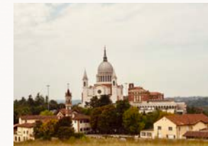
Colle Don Bosco

Auch hier ist wieder Zeit für Spiel, Spaß und (Ent)spannung.